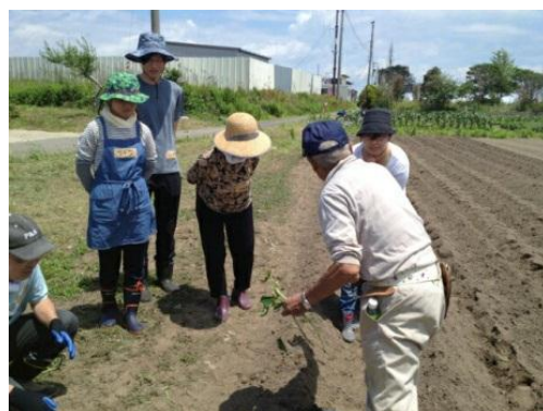
23日の作付けの様子

6月に作付けを行い、畑の手入れ作業や懇談会を8月に、収穫祭を10月に行い、参加者の方に、地域の魅力や復興へと向かっている若林区の「いま」を知って頂きたいと思っています。