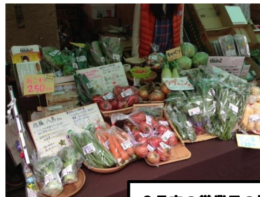
6月末の営業日の様子

「若林区復興支援ショップりるまあと」とは、ReRoots が昨年の11月から仙台朝市で毎週土曜日に開いている復興支援ショップです。若林区の被災された農家さんが作ったお野菜や復興グッズを販売し、若林区の魅力や頑張る農家さんの姿を伝え、お客さんと若林区とを繋ぐお店を目指しています。ボランティアによる復旧作業によって再生した農地でとれたお野菜もあり、どれも有機肥料・減農薬にこだわり、大切に育てられた新鮮なお野菜が毎週並びます。お客さんからは「こんなに甘い野菜は初めて!」「農家さんにも、それぞれこだわりがあるのね」といったお声も頂き、何度もご来店頂いている常連さんもうらっしゃいます。