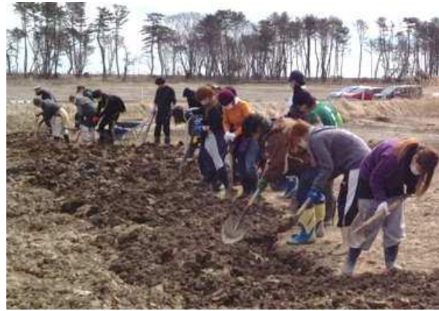
畑のガレキ撤去の様子

震災復興・地域支援サークル ReRoots は、東日本大震災の津波の被害を受けた仙台市若林区で、「復旧から復興へ、そして地域おこしへ」というコンセプトの下、農業の再生を軸に活動しているボランティア団体です。被災した農地の復旧から、農家さんが安定した営農をできるようになるまでの支援、さらには後継者問題など、元々地域にあった課題を解決するための地域おこしまでを視野に入れて活動しています。