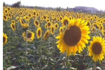
昨年のひまわり畑の様子

5月下旬から多くのボランティアさんの力をお借りして、畑に埋まった瓦礫を撤去し、6月中旬には3万粒もの種まきを終えることができました。8月の前半には、満開のひまわりが広がり、地域に彩りを与えます。また、8月10日、11日には「ひまわり祭り」を行い、ひまわりを眺めながら、楽しんで頂けるイベントを開催致しますので、多くの方に足を運んで頂けたら、と思っております。