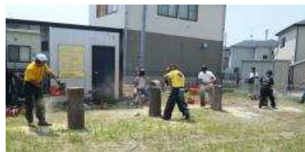
チェーンソーアート創作中

ReRoots に拠点となるボランティアハウスができました。これらはReRootsの趣旨に賛同してくださった方々から無償で提供していただいたものです。私たちは、7月16日を正式なReRootsのスタートとしてオープンイベントを開きました。