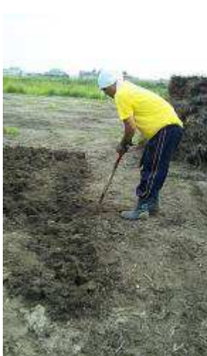
津波で固まった畑の掘り起こし

初めまして。私たちは「震災復興・地域支援サークル ReRoots(リルーツ)」といいます。ReRootsは、2011年3月11日に起きた東日本大震災で、仙台市川内コミュニティセンターに避難したメンバーが集まって作りました。