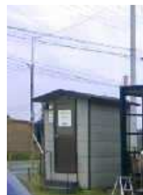
バイオマストイレ

若林ボランティアハウス(表紙の写真)はReRootsの拠点として建てられました。ここには、今後ソーラーパネルや太陽熱温水器などをとりつけ、環境に負荷を与えないボランティアハウスとして使用する予定です。